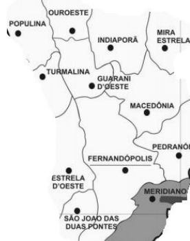
Figura 6: Mapa Municípios próximos a Meridiano