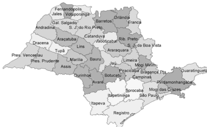
Figura 2: Mapa Microrregiões do Estado de São Paulo