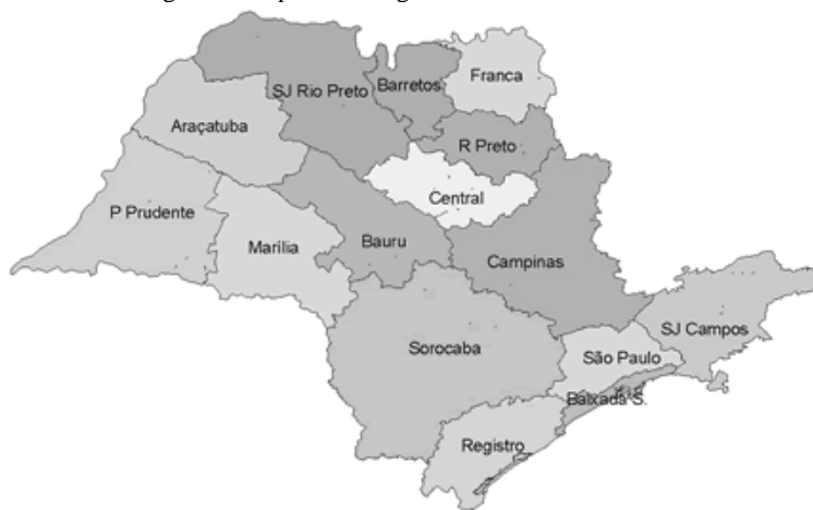
Figura 3: Mapa Mesorregião do Estado de São Paulo