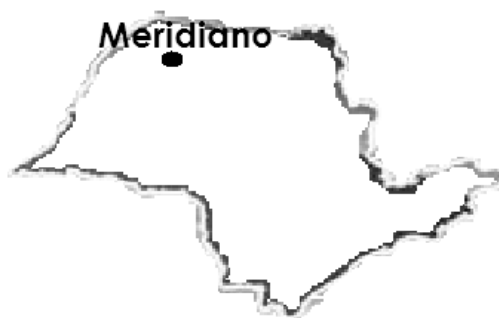
Figura 1: Mapa com a localização de Meridiano - São Paulo

O município de Meridiano, localizado na região Noroeste do Estado de São Paulo (Figura 1) com área demográfica de 229.246 m 2 , possui 3.851 habitantes, onde 1.890 são homens, 1.961 são mulheres, apresentando assim uma população urbana de 2.676, onde em sua área rural residem 1.175 pessoas (IBGE).