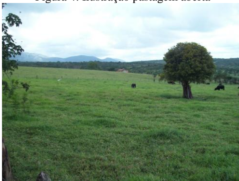
Figura 4: Ilustração pastagem aberta

Para a produção de leite um dos sistemas mais utilizados no estado de São Paulo e o de pastagem rotativa (Figura 5) que funciona de maneira mais eficaz, melhorando a qualidade e quantidade da produção leiteira, pois são formados por piquetes enumerados, onde os gados se alimentam semanal ou quinzenalmente, ocorrendo à troca nos dias determinados para que ocorra a recuperação da pastagem mantendo assim sempre a grama em bom estado e boa qualidade para a alimentação do gado. Desta forma o gado se alimenta melhor e assim produz em maior quantidade com maior margem de lucro para a produção.